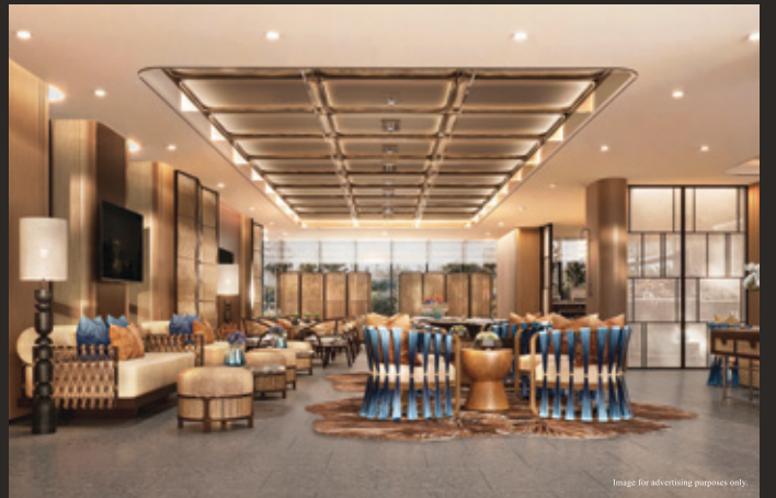
Image for advertising purposes only.