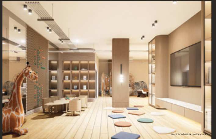
Image for advertising purposes only.