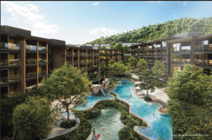
Image for advertising purposes only.